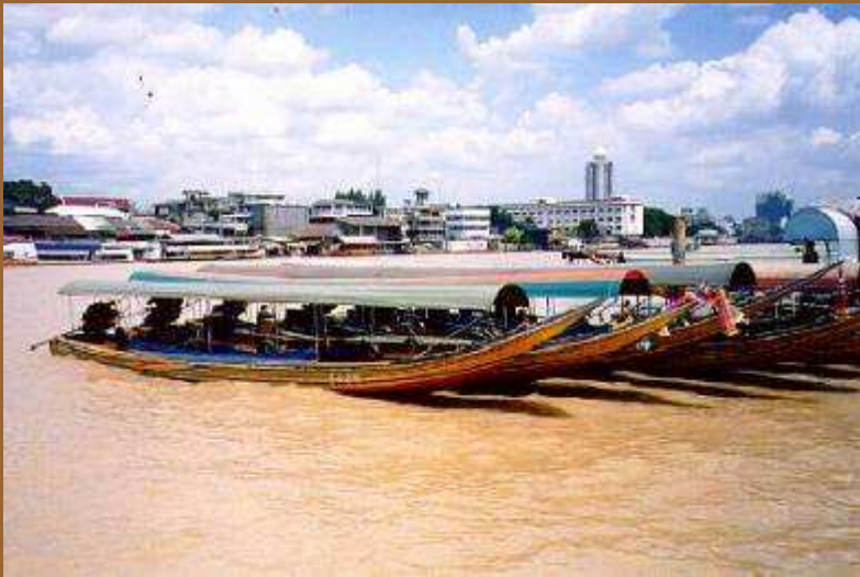
Barco-Taxi en el río Chao Phraya

Caracterizado por haber resistido todas las embestidas de las potencias occidentales que han querido siempre conquistarlo, Tailandia es el único país del Sudeste Asiático, que no ha sido colonizado nunca, de ahí que su nombre, Thailand, signifique Tierra Libre traducido al español.