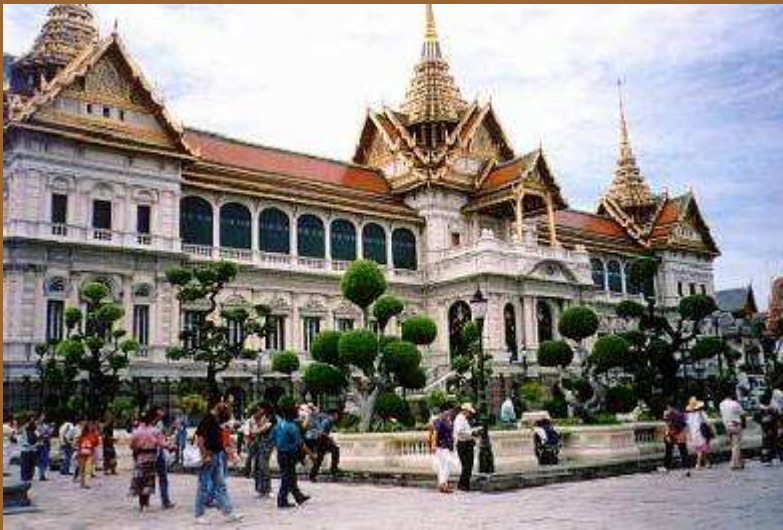
Palacio Real de Bangkok