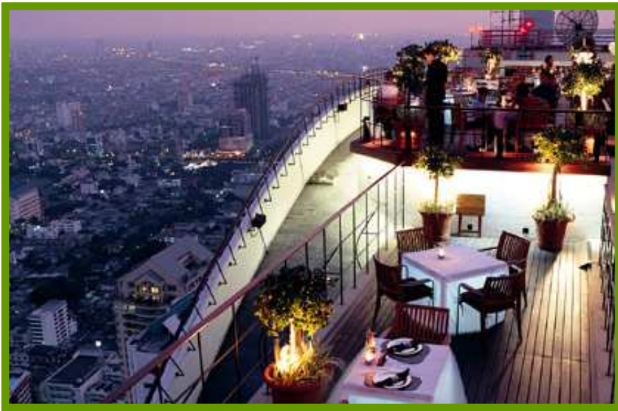
Banyan Tree Bangkok, Vertigo Restaurant