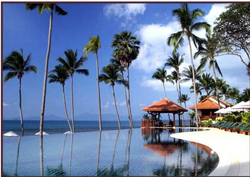
Napasai. Swimming Pool