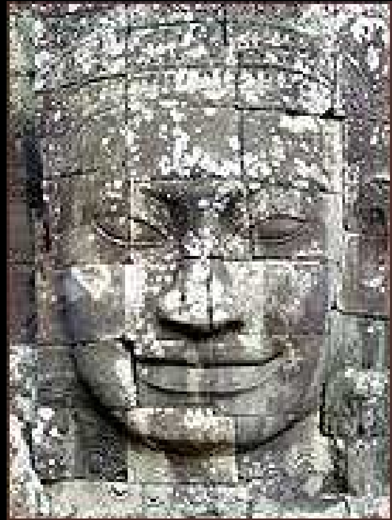
Escultura Budista tallada en Piedra

“Un lugar del Mundo, difícilmente comparable con cualquier otro”