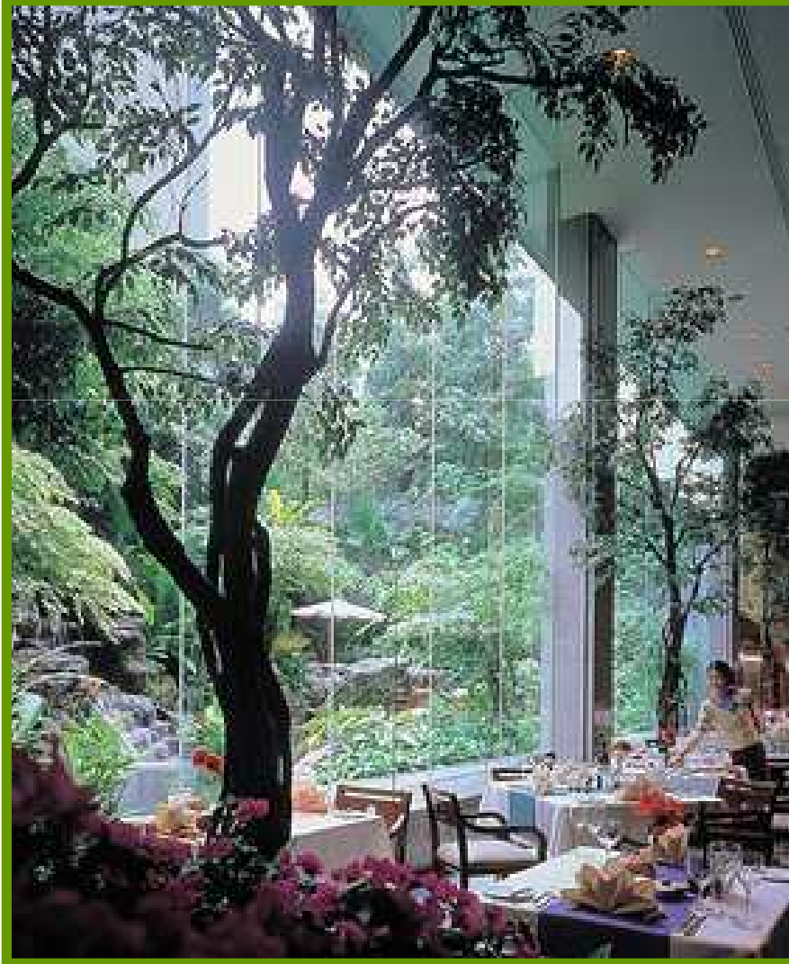
Banyan Tree Bangkok