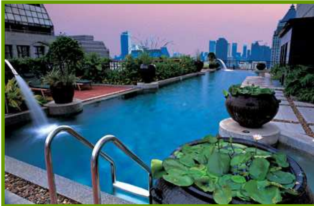
Banyan Tree Bangkok, Piscina