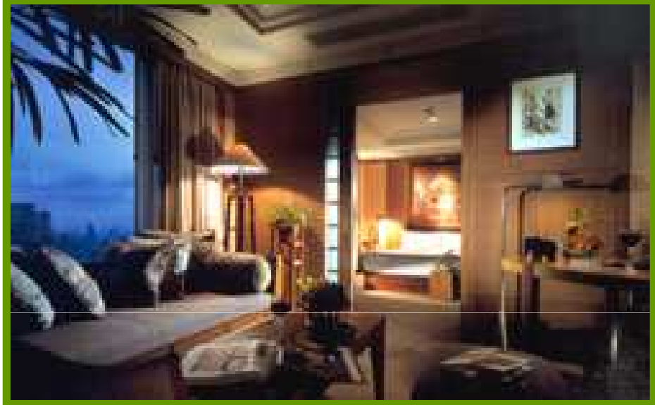
Banyan Tree Bangkok, Deluxe View Suite