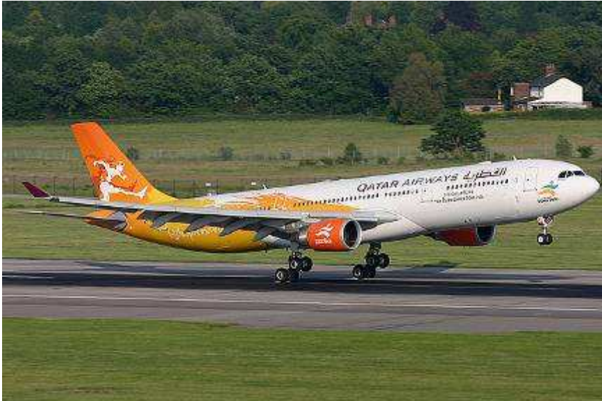
Airbus 330 – 300