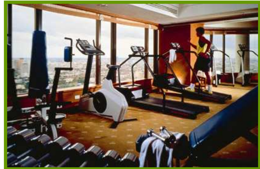
Banyan Tree Bangkok, Gimnasio