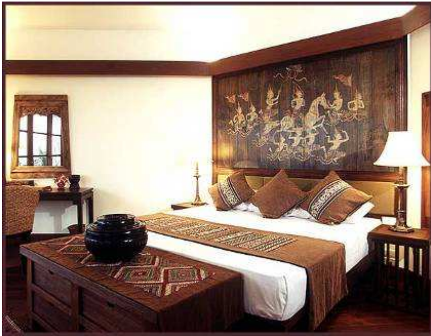
Napasai. Cottage Room