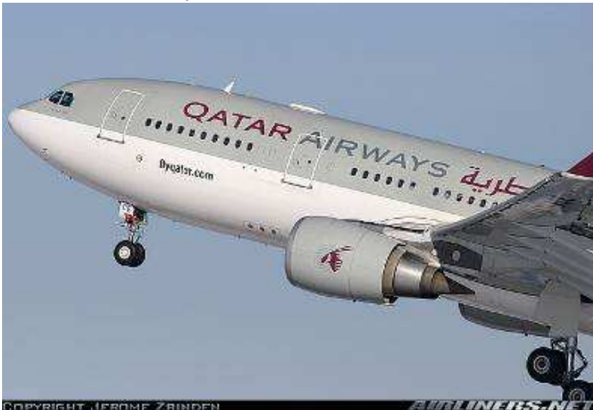
Airbus 330 – 300